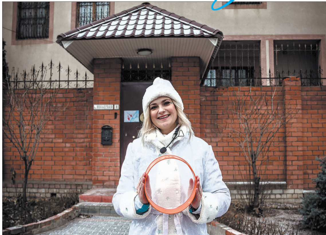
Коммунальная Снегурочка желает волгоградцам встретить Новый год без долгов и получать награды только в качестве добросовестных потребителей.

В списке свыше 30 автомобильных дорог, которые десятилетиями не получали основательного обновления. В ходе работ здесь полностью реконструируют проезжую часть, тротуары, инфраструктуру и колодцы инженерных сетей. Кроме того, продолжится строительство новых проездов.