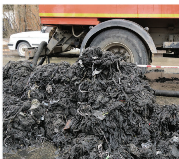
Если каждый из нас спустит в унитаз по одной тряпочке, с канализацией придется попрощаться надолго.

ВАЖНО В унитаз нельзя выбрасывать хозяйственно-бытовой мусор, предметы личной гигиены, пакеты, стекло и пластик. В мусоропровод, а не в унитаз, следует отправлять и остатки еды, кости, жирные соусы и масла. А сброс в канализацию строительного мусора абсолютно недопустим! Это неизбежно будет приводить к порче канализационных коллекторов и, как следствие, к трудноустраняемым засорам. Водоканал напоминает: канализация предназначена исключительно для жидких бытовых отходов, для всего остального есть мусорное ведро.