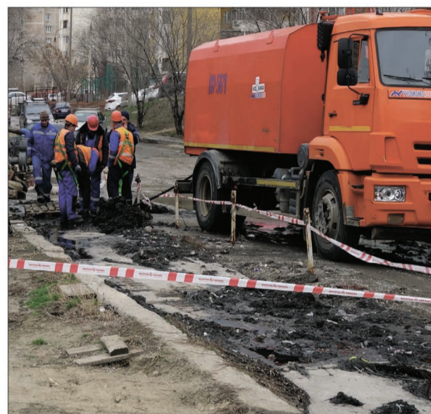
Мощная каналопромывочная машина не смогла справиться с засором на ул. Хользунова, устранять пришлось вручную.

Смывая в унитаз тряпочку, горожанин думает (если думает, конечно), что одна маленькая тряпочка никому не помешает. И две... И три... А сто? А тысяча? Вспомните об этом, когда решите, что от вас одного ничего не зависит. Когда так думает каждый второй, страдает коммунальное — общее — хозяйство.