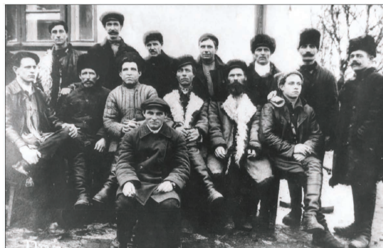
Рабочие горканыализации, 1928 г.

С открытием Единого диспетчерского центра (о нём — на стр. 1) волгоградская коммуналка шагнула в XXI век. И это повод вспомнить, как всё начиналось. Когда в нашем городе появились диспетчеры, управляющие сетями?