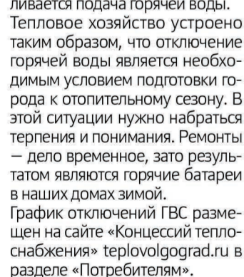
Когда в домах отключают горячую воду, на сетях и в котельных кипит работа.

График отключений ГВС размещен на сайте «Концессий теплоснабжения» teplovolograd.ru в разделе «Потребителям».