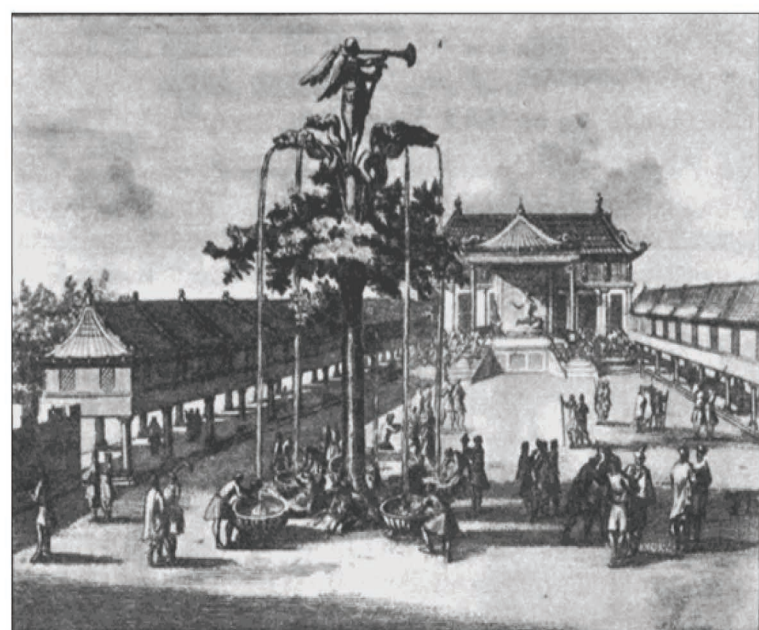
В ханских дворцах были такие фонтаны, что-то похожее наверняка было и в Гюлистане.

Уровень благоустройства Гюлистана просто поразительный. Воду (в том числе и талую) собирали в искусственные озера и по каналам подавали в город. Сложные гидротехнические сооружения регулировали уровень окружающих водоемов, благодаря чему в городе постоянно была вода. Система шлюзов и плотин позволяла наполнять эти бассейны водой Ахтубы или сливать лишнее. По арыкам вода доходила до каждого дома. А во дворцах были фонтаны в привычном для нас смысле слова. Электромоторов, конечно, еще не придумали, поэтому напор воды обеспечивали вручную. А еще здесь были общественные бани и туалеты. Это в то время, когда Европа мылась раз в год и ходила под кустик.