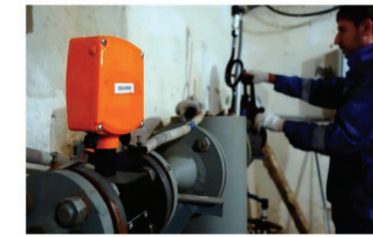
Расчеты платы за тепло выглядят сложными, но по сути не сложнее самой системы обогрева миллионов города.

вая все семь месяцев отопительного сезона. В октябре и апреле жители домов, где плата рассчитывается по нормативу, платят столько же, сколько и в самые холодные месяцы. У такой системы расчётов есть свой плюс — в самый холод плата у «нормативщиков», как правило, получается ниже, чем у тех, кто платит по показаниям прибора учета. Но устанавливать ОДПУ на тепло не право, а обязанность в соответствии с действующим законодательством РФ.