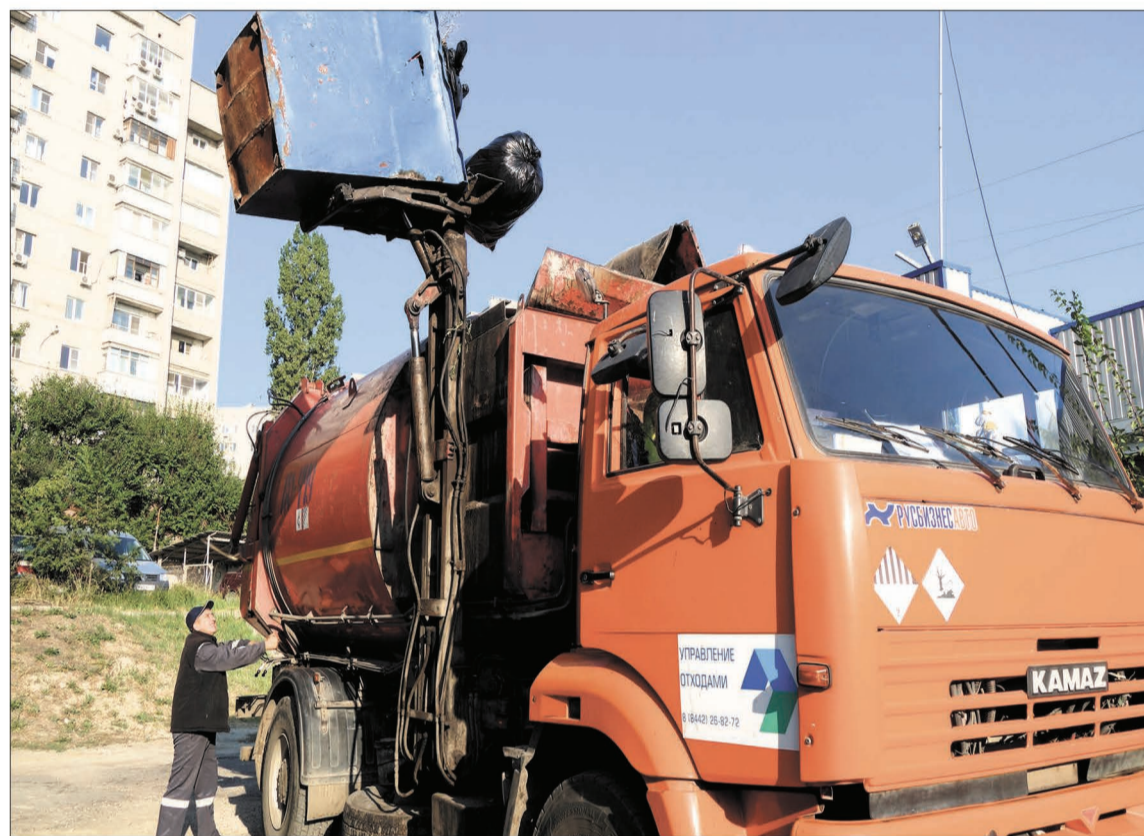
Новые подходы к обращению с бытовыми отходами избавят от мусора всю страну.

26 светодиодных светильников осветят дорогу к кардиоцентру, 22 — улице Автотранспортная. Освещение улиц налаживается в рамках концессионного соглашения между муниципалитетом и ООО «Светосервис — Волгоград».