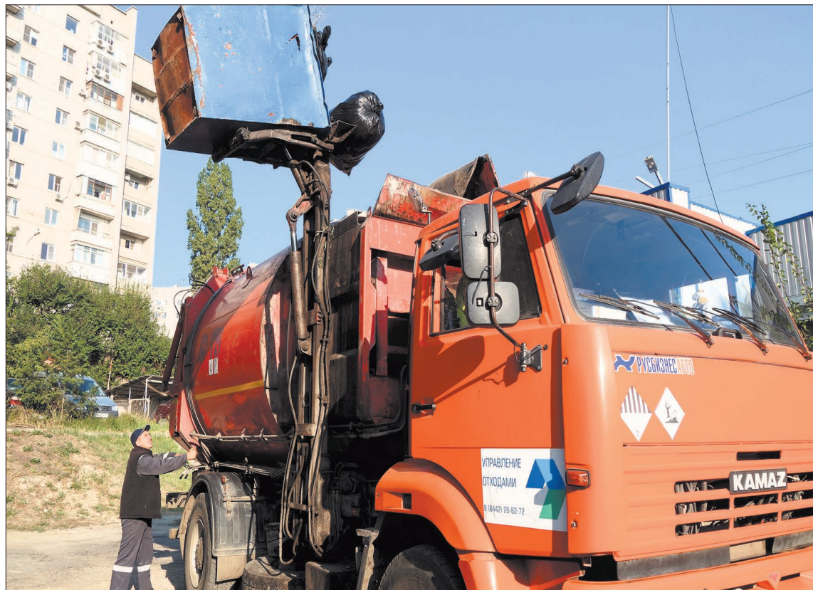
Новые подходы к обращению с бытовыми отходами избавят от мусора всю страну.

26 светодиодных светильников осветят дорогу к кардиоцентру, 22 — улице Автотранспортная. Освещение улиц налаживается в рамках концессионного соглашения между муниципалитетом и ООО «Светосервис — Волгоград».